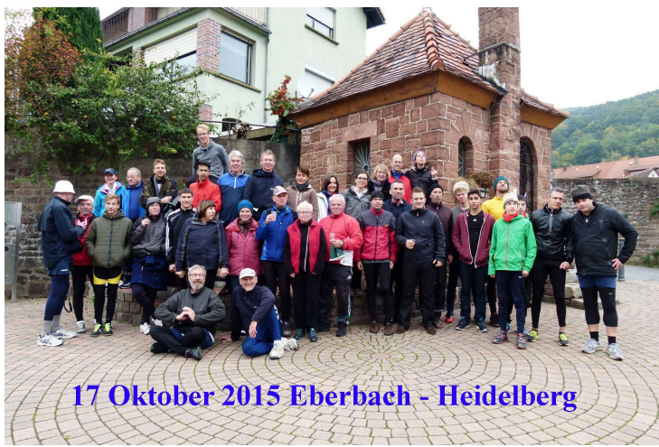
17 Oktober 2015 Eberbach - Heidelberg