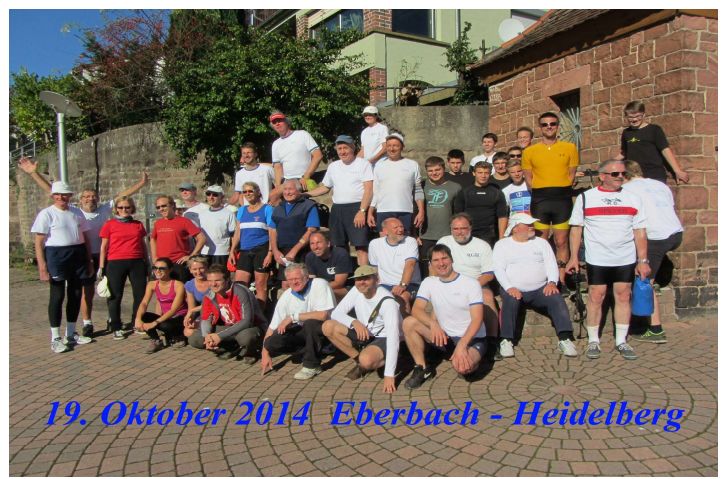
19. Oktober 2014 Eberbach - Heidelberg