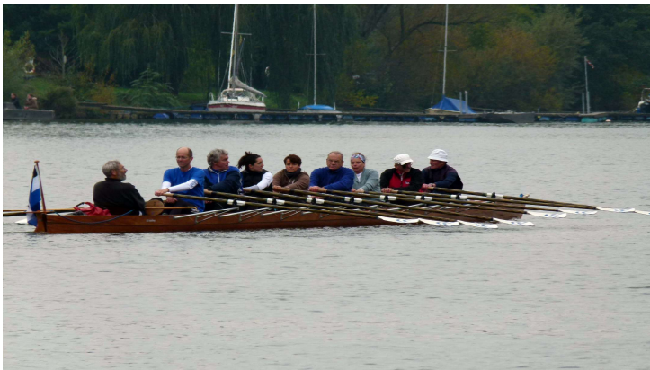
Ich hoffe auf gutes Wetter

Konto: Dr. Michael Herbring APO Düsseldorf BIC DAAEDEDXXX IBAN DE25 3006 0601 0202 3648 91 Text: Tagesfahrt Eberbach 2016 – Tagesfahrt Rhein.