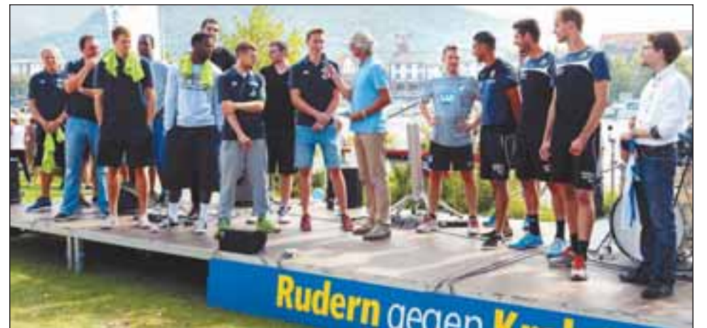
Auch prominente Fuß- und Basketballer engagierten sich gestern im Kampf gegen Krebs.