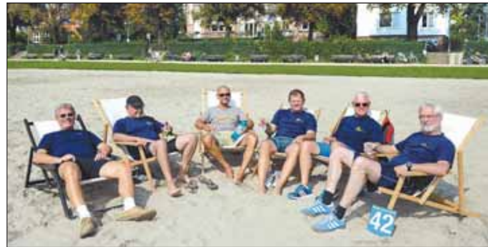
Auch das gehört zum Rudersport: die Entspannung in geselliger Runde.