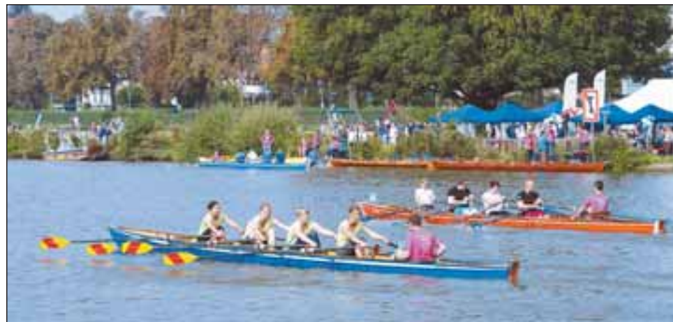
78 Viererteams – darunter viele Freizeitsportler – traten gegeneinander an.