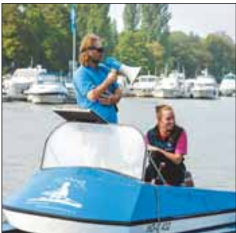
Alles hörte auf sein Kommando.