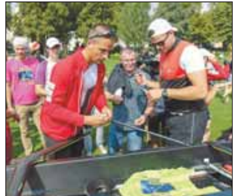
Die Profis vom Deutschland-Achter gaben tüchtig Autogramme.