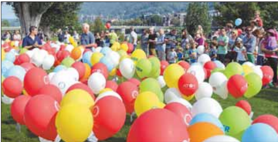
2500 Benefiz-Ballons gingen von der Neckarwiese aus auf große Reise.