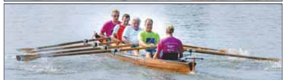
Prominenz aus Politik, Wirtschaft und Medizin legte sich in die Riemen.