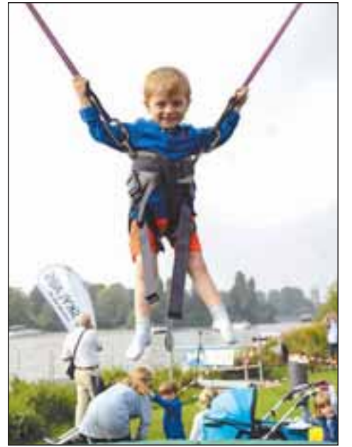
Man musste nicht rudern: Dieses Kind hatte auf dem Trampolin sichtbar viel Spaß.