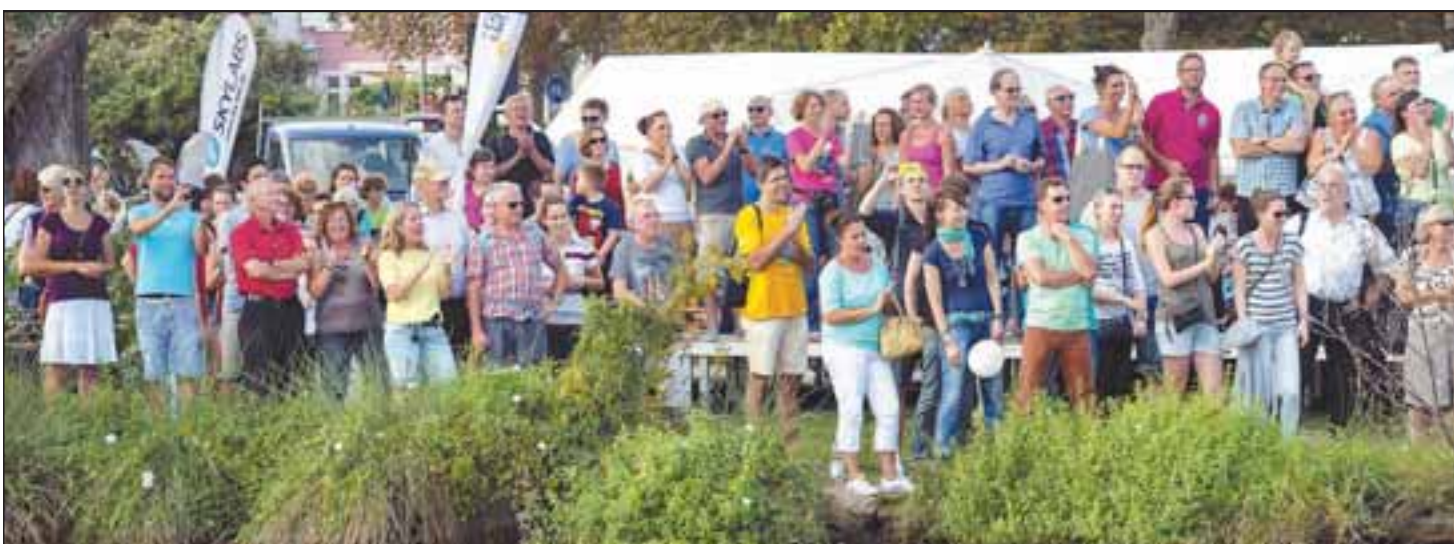
„Rudern gegen Krebs“ ist vor allem auch ein Volksfest am Neckar: Hunderte feuerten gestern die Sportler vom Ufer aus an.