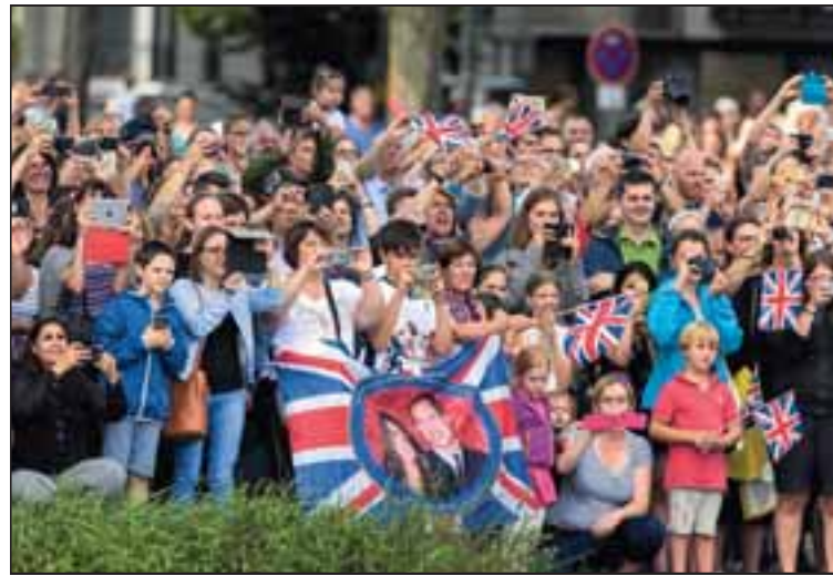
Royale Fans in Heidelberg: Am Neckarufer werden bei der Ruderregatta fleißig Fähnchen geschwenkt – und natürlich Fotos gemacht.