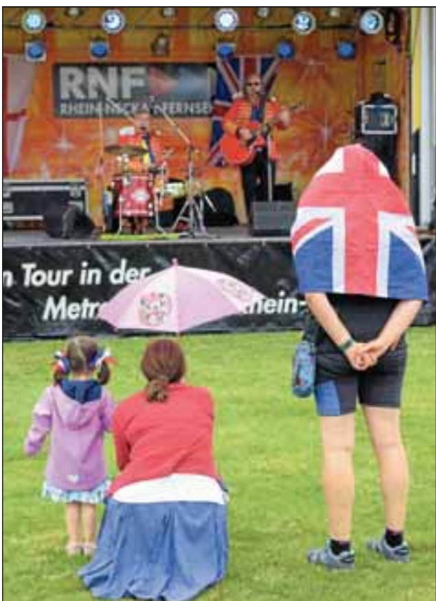
Auf der Bühne an der Wasserschachtel spielen „Kings Cross“ – natürlich auch Beatles-Stücke.