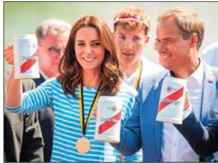
Prost, Heidelberg! Nachdem ihr Mann den Fassbieranstich gemeistert hat, stößt Kate mit OB Würzner an.