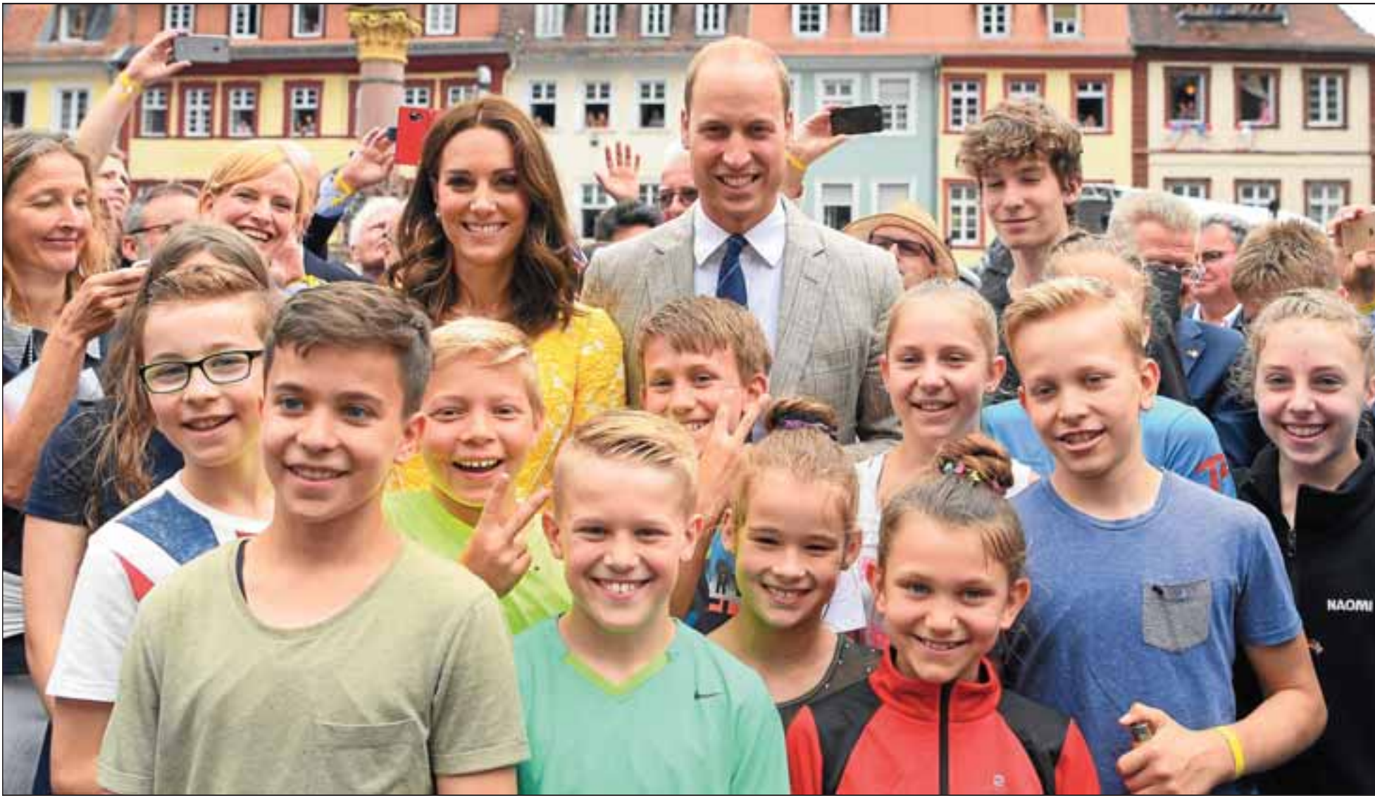
Auf dem Marktplatz haben William und Kate besonders viel Spaß. Locker und gut gelaunt unterhalten sie sich mit vielen der Ehrengäste – und posieren für Hunderte Handykameras, die selbst gestandene Stadträte und mancher Bürgermeister in die Höhe recken. Besonders glücklich sind diese Kinder, mit denen das Prinzenpaar einige Zeit geschäkert hat.