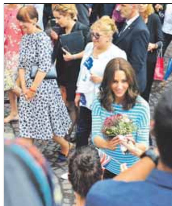
Aus dem Publikum bekommt Herzogin Kate einen Blumenstrauß geschenkt.