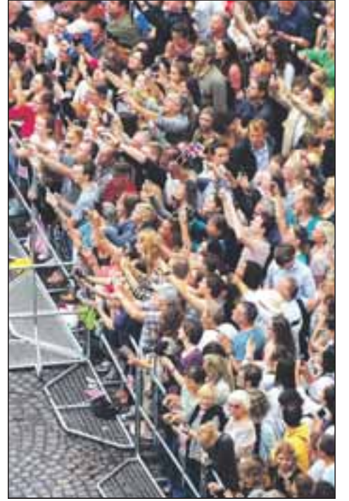
Handys hoch! Am Marktplatz hoffen die Zaungäste auf ein gutes Foto.