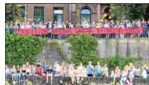
Das Plakat an der Stadthalle ist wohl als Kritik am Königshaus gedacht.