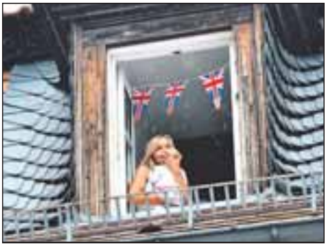
Fenster zum Marktplatz: Mutter und Kind sind im königlichen Fieber.