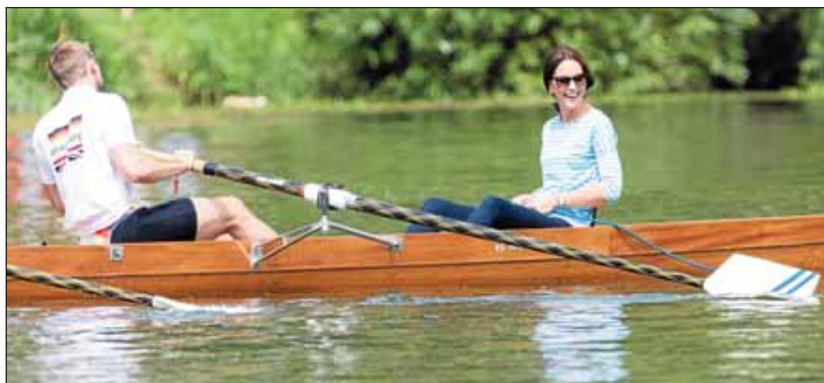
Bei der Ruderregatta auf dem Neckar hat Kate sichtlich Spaß. Das Rennen von der Alten bis zur Theodor-Heuss-Brücke war wohl der entspannteste Programmpunkt ihres Deutschland-Besuchs.