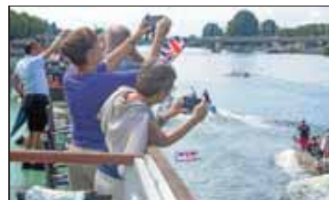
Premium-Blick von der Königin Silvia: Fans machen Fotos vom Rennen.