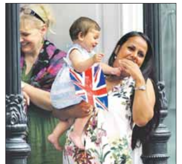
Königlich gute Laune herrscht gestern auf dem Marktplatz bei Jung und Alt.